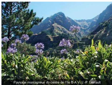
Paysage montagneux du centre de l'île