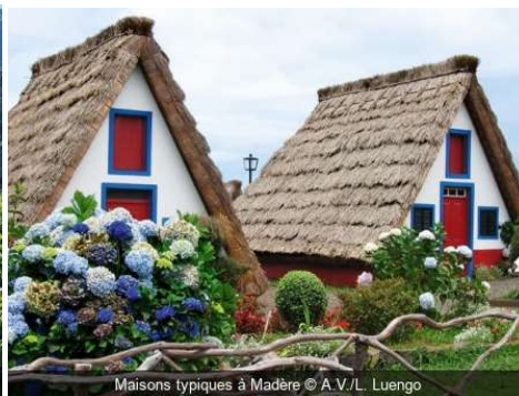
Maisons typiques à Madère