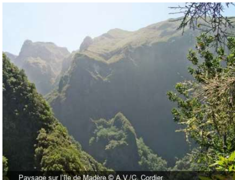
Paysage sur l'île de Madère