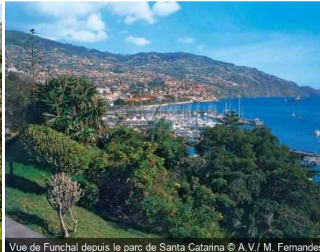
Vue de Funchal depuis le parc de Santa Catarina